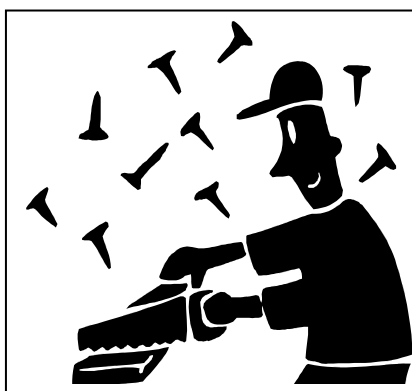
Figura retirada do www.segurancaetrabalho.com.br

39) A figura acima demonstra um trabalhador que não está fazendo uso do equipamento de segurança individual, destinado a proteger sua integridade física. Dos equipamentos abaixo, qual o trabalhador deveria estar utilizando para a execução da atividade representada na figura acima?